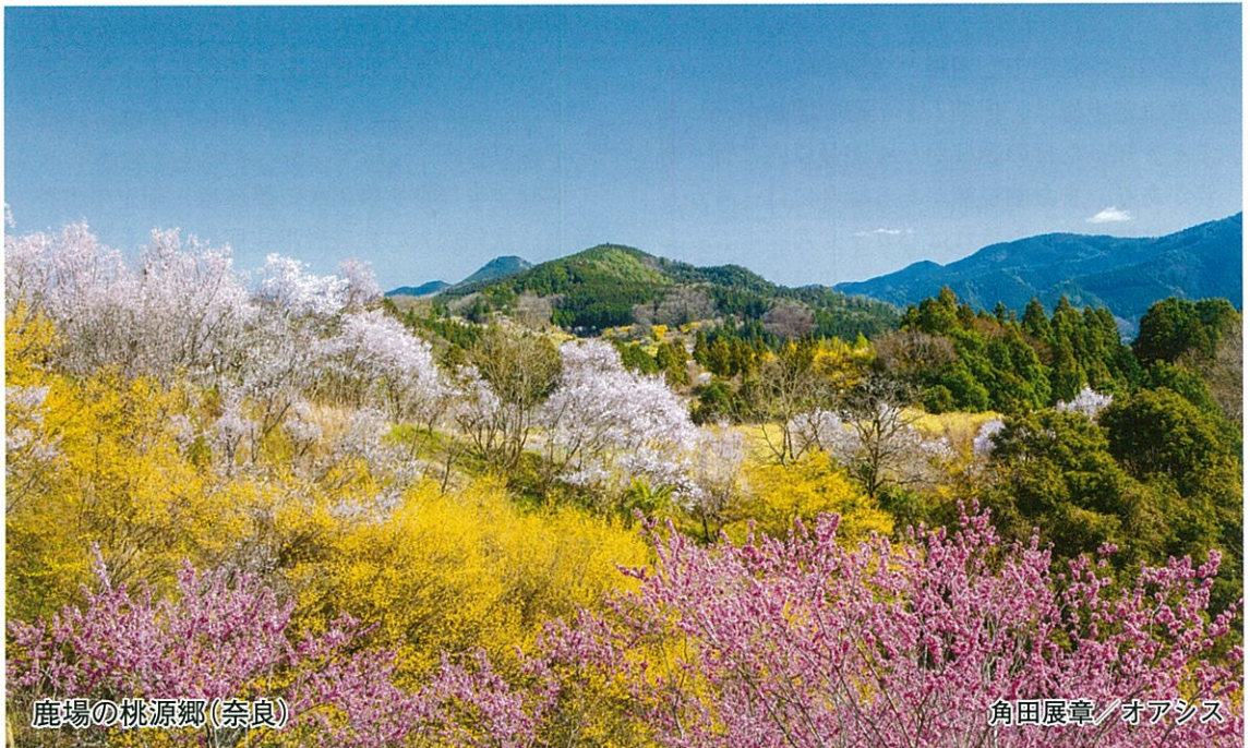
鹿場の桃源郷(奈良)