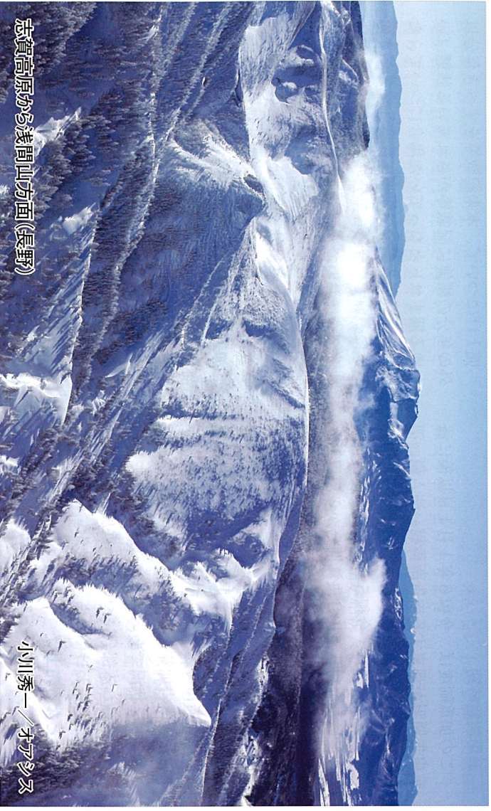
志賀高原から美間山方面(長野)